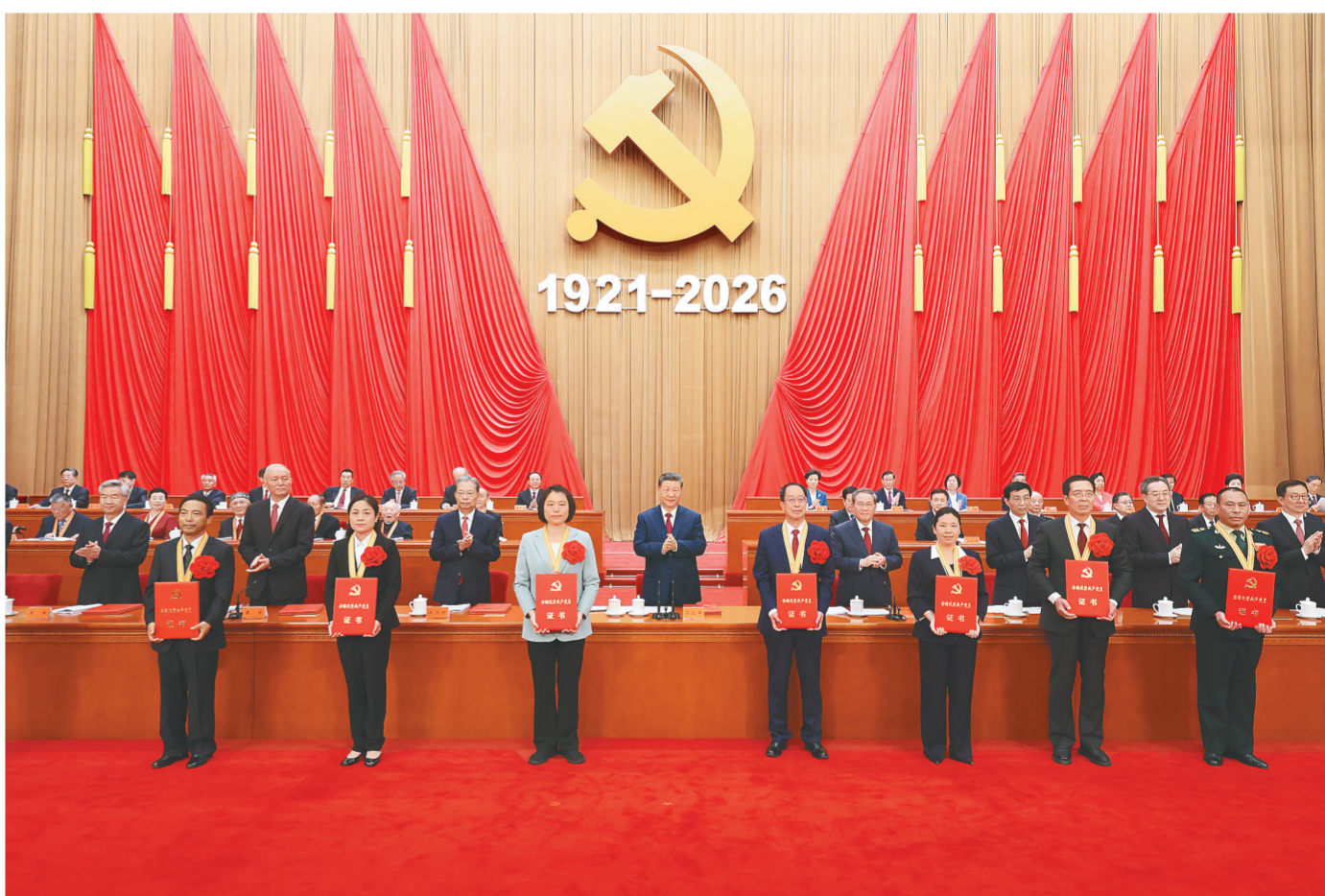
7月1日上午，庆祝中国共产党成立105周年大会在北京人民大会堂隆重举行。这是习近平等党和国家领导人向受表彰的全国“两优一先”代表颁奖。

习近平强调，实现新时代新征程党的使命任务，要求全体中国共产党人坚定信心、接续奋斗，不断创造无愧于时代和人民的新业绩。坚定信心、接续奋斗，必须坚持党的基本理论、基本路线、基本方略，坚持党的全面领导和党中央集中统一领导，深入贯彻新时代中国特色社会主义思想，坚定道路自信、理论自信、制度自信、文化自信，继往开来、守正创新，做到不畏浮云遮望眼、乘风破浪不迷航。必须紧紧依靠人民创造历史伟业，践行以人民为中心的发展思想，充分激发亿万人民的积极性主动性创造性，统筹推进“五位一体”总体布局、协调推进“四个全面”战略布局，完整准确全面贯彻新发展理念，加快构建新发展格局，扎实推动高质量发展。必须积极应对外部挑战，推动落实全球发展倡议、全球安全倡议、全球文明倡议、全球治理倡议，为世界和平与发展注入更多正能量。必须持之以恒推进全面从严治党，全面贯彻新时代党的建设总要求，健全全面从严治党体系，以党的政治建设为统领加强党的各方面建设，坚决打好反腐败斗争攻坚战持久战总体战，不断增强党的政治领导力、思想引领力、群众组织力、社会号召力。