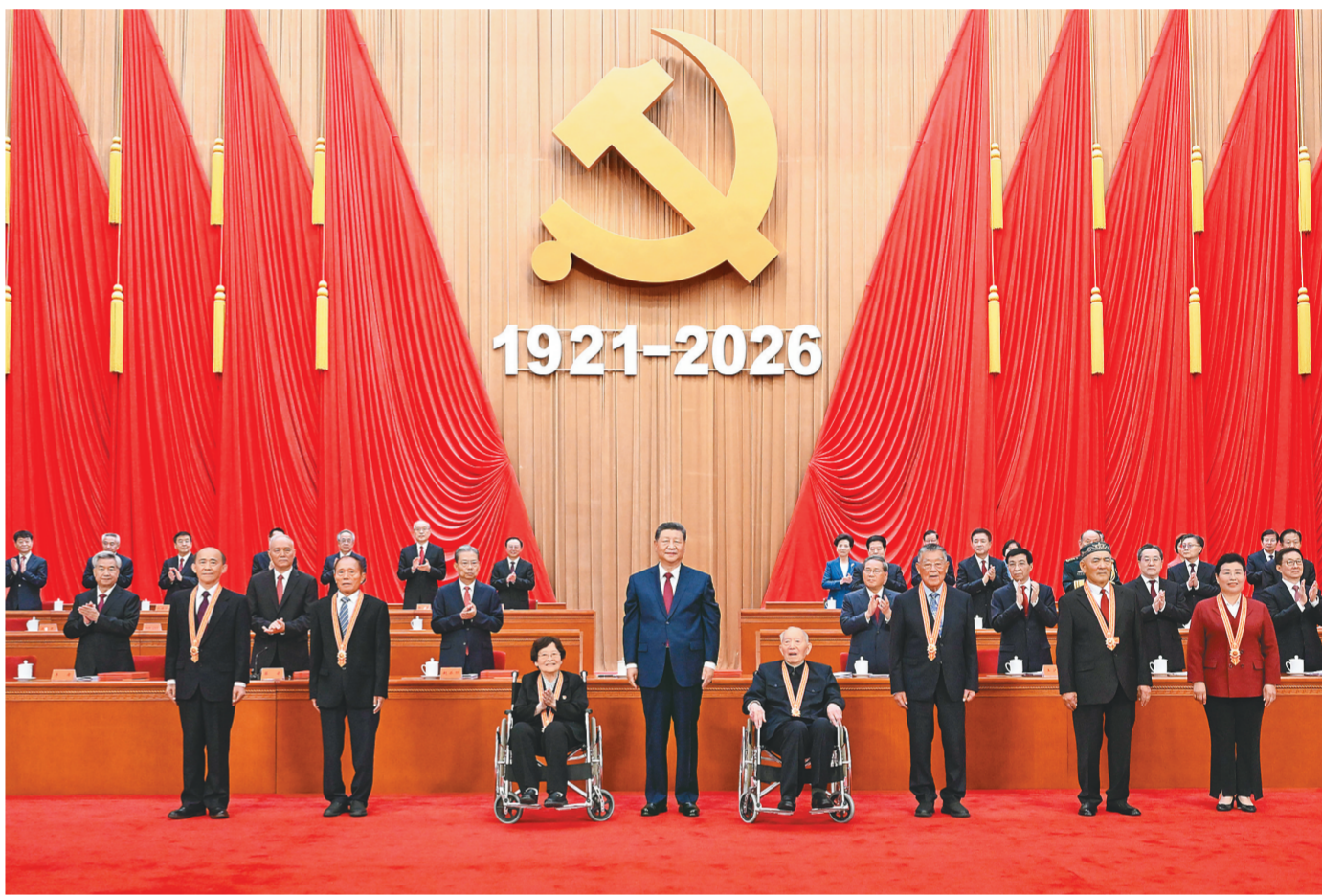
7月1日上午，庆祝中国共产党成立105周年大会在北京人民大会堂隆重举行。中共中央总书记、国家主席、中央军委主席习近平向“七一勋章”获得者颁授勋章。

新华社北京7月1日电 庆祝中国共产党成立105周年大会7月1日上午在北京人民大会堂隆重举行。中共中央总书记、国家主席、中央军委主席习近平向“七一勋章”获得者颁授勋章并发表重要讲话。他强调，105年来，我们党始终坚守为中国人民谋幸福、为中华民族谋复兴的初心使命，在不懈奋斗中创造了彪炳史册的伟大成就。新征程上，全党同志要坚定信心、接续奋斗，不断创造无愧于时代和人民的新业绩。