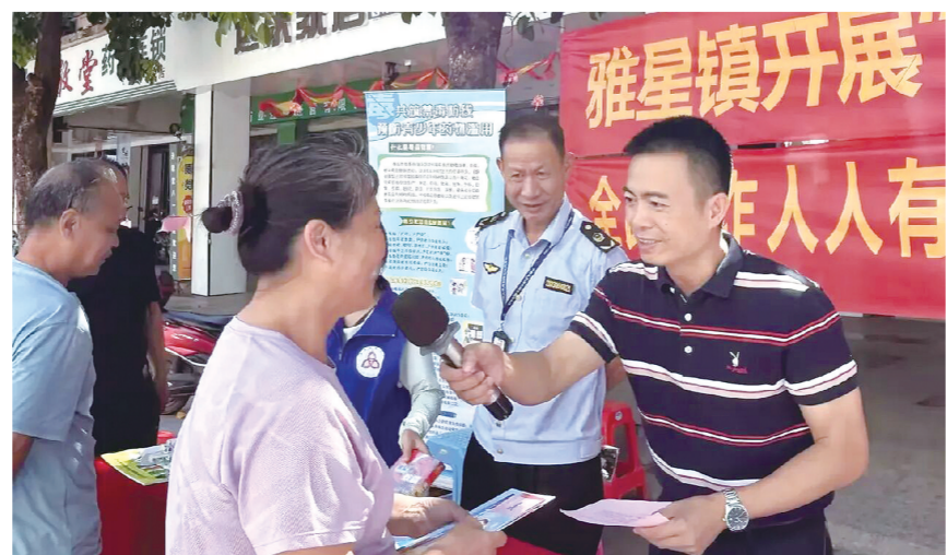
6月24日，儋州市雅星镇开展禁毒宣传，群众积极参与与互动。

踏查工作以易涉种区域为重点，组织工作人员分组分片进行排查。行动覆盖田间地头、山林坡地等可能种植毒品原植物的区域，确保无死角、无遗漏。