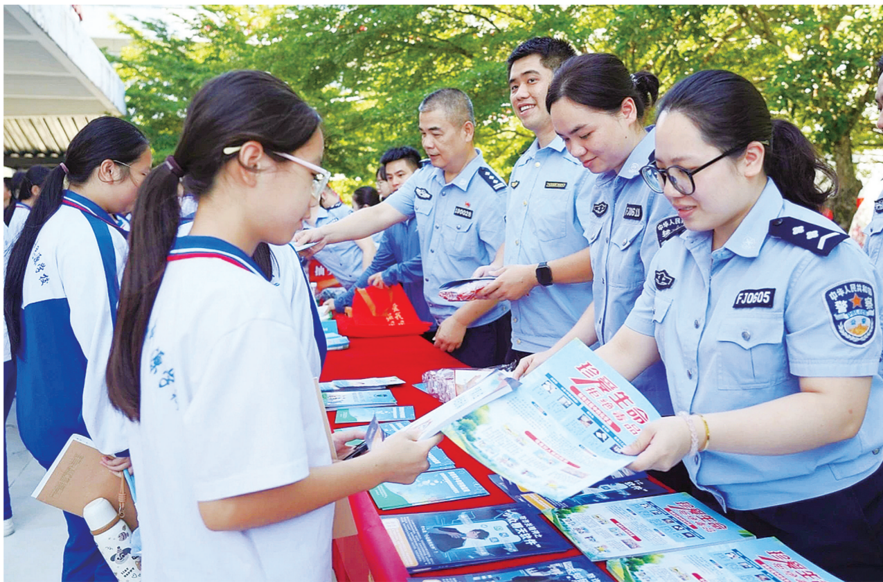
6月24日,琼中公安局民警、辅警到华中师范大学琼中附属中学思源实验学校开展禁毒宣传。