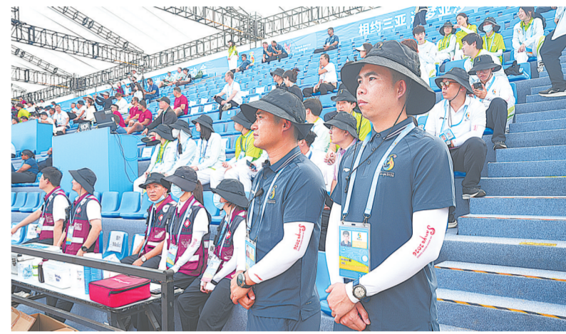
4月23日，三亚市公安局天涯分局凤凰派出所民警在御海路竞赛场馆开展安保工作。

4月23日下午4时，第六届亚洲沙滩运动会沙滩足球比赛在御海路竞赛场馆群正式开踢，开赛不久伊朗队率先阿联酋队取得进球，当大屏幕上显示出4个英文字母“GOAL”时，观众席爆发出阵阵掌声与欢呼声。