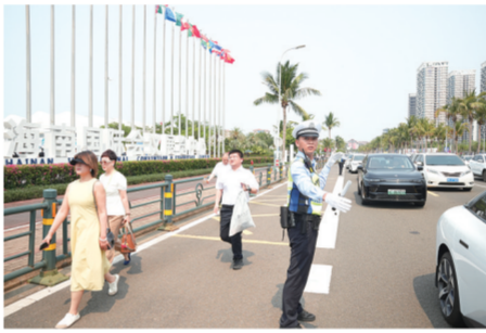
场馆外，海口市公安局交通管理支队龙华大队民警正在疏导车辆。