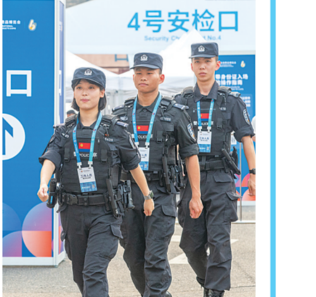
在消博会现场，海口市公安局特警支队民警正在开展治安巡逻。