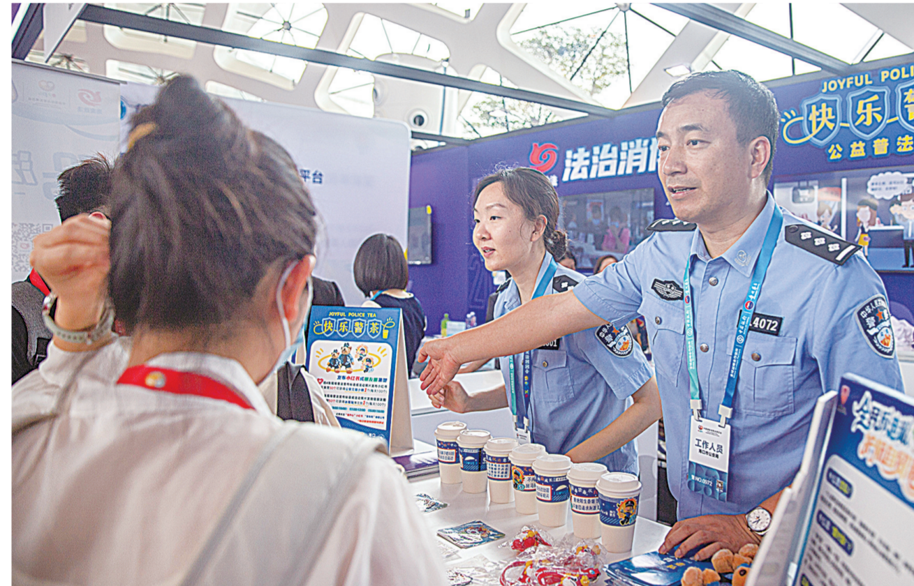
4月13日，在消博会法治服务专区，省委政法委联动海口市公安局打造的“警茶局”开展普法主题茶饮派发活动。

海南公安将继续以忠诚为盾、以担当为笔，在南海之滨续写平安篇章，为自贸港扬帆远航、逐浪前行筑牢最坚实的安全保障，守护这片热土向着高水平开放与发展笃定前行。