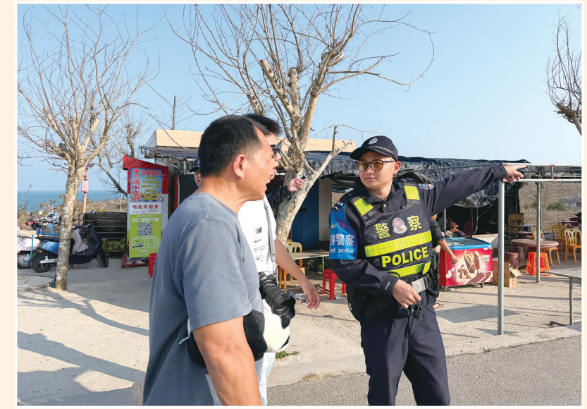
2月20日,文昌木兰湾海岸派出所执勤警力为群众提供帮助。