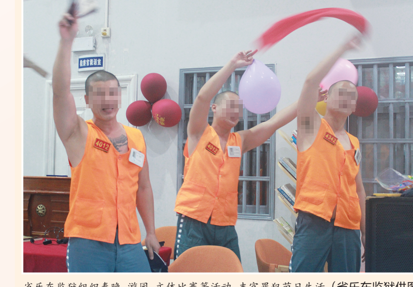
省乐东监狱组织春晚、游园、文体比赛等活动,丰富罪犯节日生活。