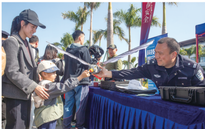
市民群众近距离围观前沿警务装备展示。