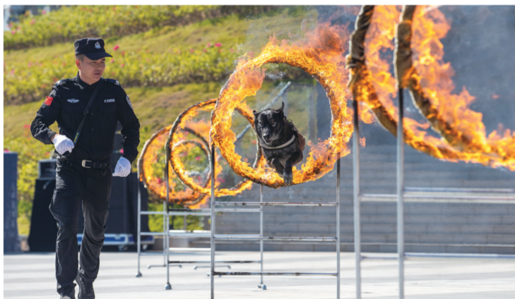
警犬综合技能展示。