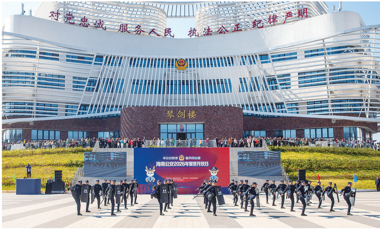
特警向参加开放日活动的市民群众表演盾牌战术操演。