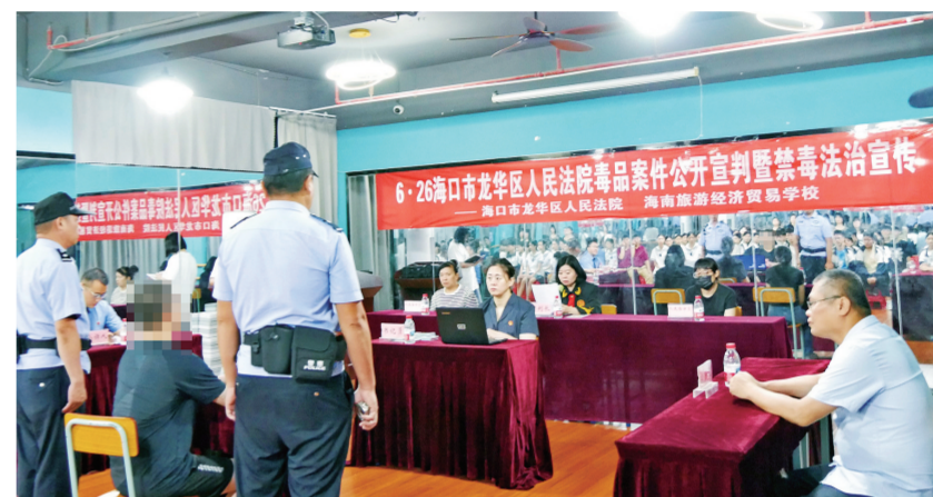
海口市龙华区法院开展毒品案件公开宣判暨禁毒法治宣传。

战场到普法宣传一线，龙华区法院刑事审判庭在护航平安海口的建设道路上步履不停。展望未来，刑事审判庭将继续坚守司法公正底线，不断提升审判质效，