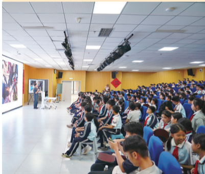
海口市龙华区法院刑事审判庭开展送法进校园活动。

近年来，海口市龙华区人民法院刑事审判庭充分发挥刑事审判职能作用，依法严惩各类违法犯罪，纵深推进常态化扫黑除恶斗争，深入开展护苗专项行动，探索创新多元化普法模式，以有力量、有温度的高效司法实践，守护群众万家灯火，为平安海口建设注入坚实法治力量。