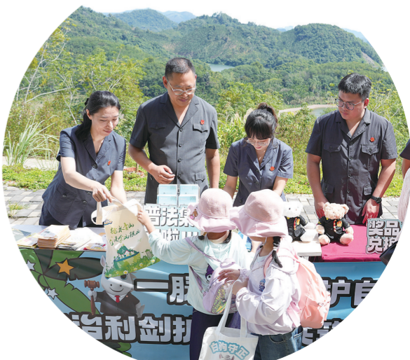
8月15日全国生态日，雨林生态普法集市。