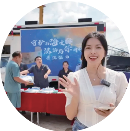
“车载便民法庭”走入千年渔港潭门开展普法服务。

2024年6月19日，海南自由贸易港国际商事纠纷解决中心在海南一中院正式挂牌成立。该中心由省委政法委牵头，省高院、省司法厅共同参与，海南一中院具体组织实施，功能涵盖诉讼、仲裁、调解、公证、审计、域外法查明、法律咨询等服务。该中心还入驻海口江东法务区，持续为自贸港打造对外开放新高地提供更便捷、高效的司法服务与保障。 深化府院联动是化解行政争议的关键抓手。海南一中院推动辖区10个基层法院实现行政争议调处中心全覆盖，建立“调处中心+行政复议+司法参与”府院联动协同机制。 在“向数图强”的数字经济领域，围绕数字藏品、数据流动、游戏虚拟财产等新型纠纷，联合辖区法院对园区开展上门服务，对企业经营过程中多发、易发的法律风险进行提醒防范，帮助企业将法律风险控制关口前移，实现从“事后维权”到“事先预防”转变。