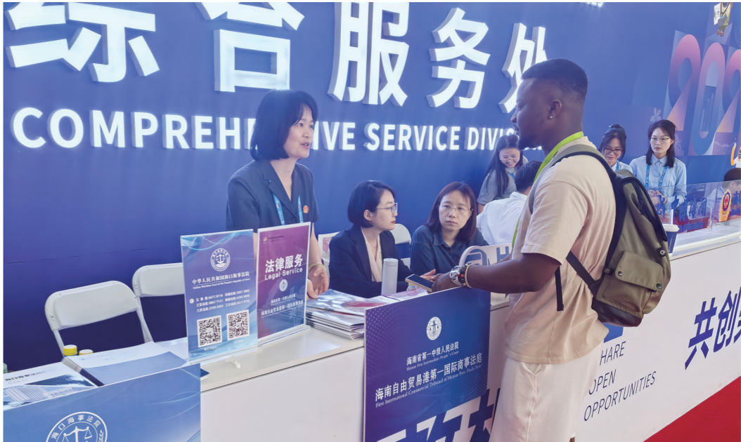
4月13日，第五届中国国际消费品博览会现场，海南一中院组建司法服务保障团队，为参展商及游客提供坚实法治保障。

随着海南自由贸易港正式启动全岛封关运作，政策红利持续释放。依托自贸港政策优势，海南持续推动“向种图强”“向海图强”“向天图强”“向绿图强”“向数图强”的“五向图强”战略，以新质生产力激活高质量发展新动能。 近年来，海南省第一中级人民法院立足审判职能，紧紧围绕服务保障自贸港建设大局，聚焦“五向图强”战略，从司法保障、多元解纷、创新普法等多维发力，用一个个鲜活案例、一项项创新举措，为“五向图强”筑牢法治基石，彰显司法担当。