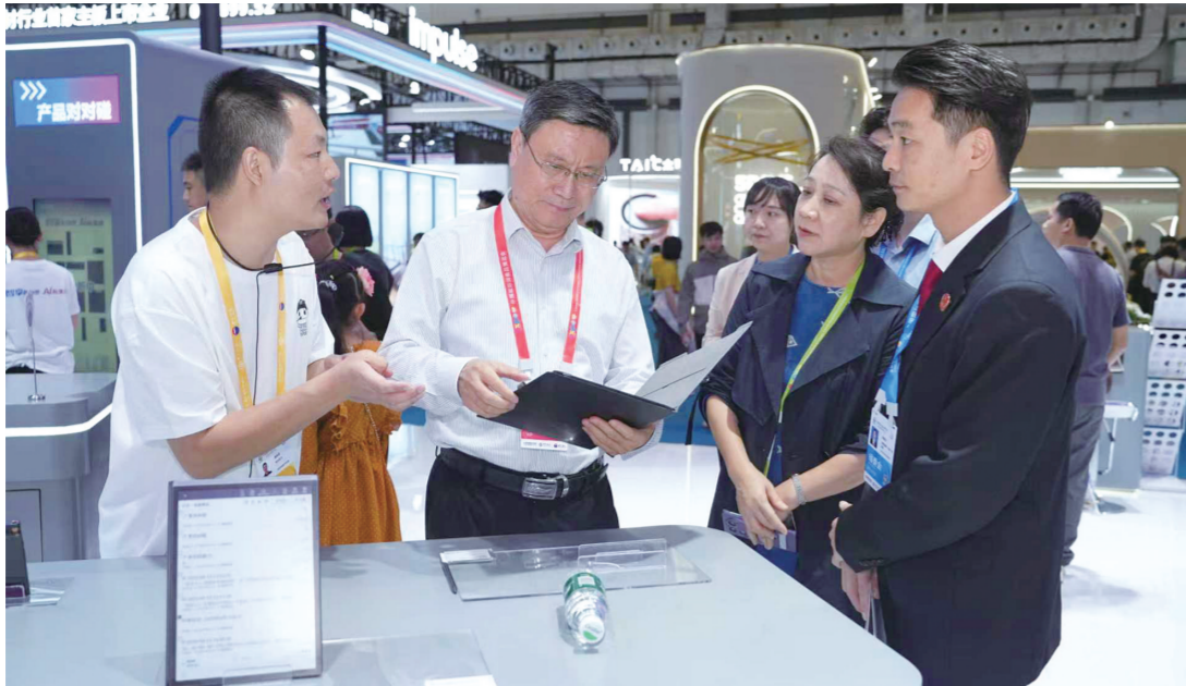
海南一中院党组书记、院长郑兰清（左二）在消博会现场走访部分参展企业。