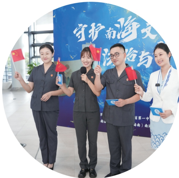
9月30日，人民法院新闻传媒总社、海南一中院、琼海法院联合在中国（海南）南海博物馆开展“守护南海文脉 法治与你同行”全媒体直播普法活动。

某某刑罚，而且将其补种数百株树苗的生态修复成效纳入庭审考量，让“砍树要补林、违法要担责”的理念深入人心。庭审结束后开设的“法律解忧杂货铺”，通过互动游戏、现场咨询等形式，让生态保护法治意识扎根基层。 围绕防范化解涉自贸港建设重大风险，海南一中院坚持靶向发力，为重点领域发展提供全链条司法保障，严厉打击离岛免税“套代购”“洗钱”、电信诈骗及相关联犯罪等严重侵害人民群众切身利益的违法犯罪行为，为企业破产重整成功提供了坚实的司法保障，有效减少金融风险发生，为自贸港封关运作营造安全稳定的社会环境。