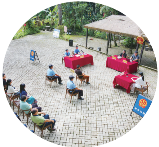
8月15日全国生态日，环资巡回审判进黎乡。

大普法覆盖面，为商业航天产业发展营造良好法治环境。 从数字园区到航天新城，从雨林深处到渔港码头，海南一中院的普法活动精准对接“五向图强”需求，让法治从“文件里”走进群众生活中。 潮起海之南，奋进新征程。海南一中院将持续聚焦“五向图强”战略部署，深化司法改革创新，强化司法服务保障，以高水平法治护航新质生产力发展，为海南自贸港建设书写更加精彩的司法答卷。 （霞汉）