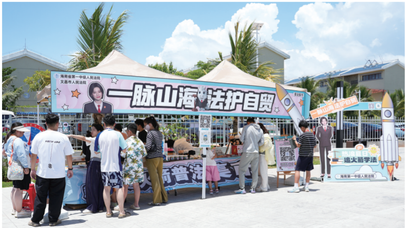
8月13日，海南一中院与文昌法院联合主办的“护航五向图强”系列普法活动首期——“夏日热浪追火箭”普法集市在文昌航天观礼中心正式启幕。