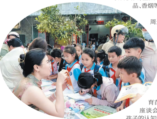
三亚市海棠区组织开展普法宣传活动。

护苗专项行动启动之初，海棠区便深刻认识到，唯有凝聚多方力量，健全工作机制，才能形成保护未成年人的强大合力。 为此，该区迅速成立未成年人护苗专项行动领导小组，印发《海棠区未成年人护苗专项行动方案》，建立周报、月总结工作制度，通过专题部署会、调度会，打通部门协作壁垒，确保各项工作同向发力。 “有了统一的调度机制，我们和公安、教育等部门的配合更顺畅了。”海棠区民政局相关负责人介绍。为确保工作落地见效，海棠区开展多批次“四防”组长单位督导检查，对村（社区）包保帮扶对象核查，通过通报约谈等方式，及时整改问题、补齐短板，压实各方责任。 针对六类重点未成年人群体，该区创新推行“责任到人、帮扶到户”的包保帮扶机制，建立“一人一档”动态管理台账，每月更新护苗平台数据，让每一名需要帮助的未成年人都能得到精准关爱。 校园周边环境是未成年人成长的重要阵地。3年来，区委政法委牵头联合民政、教育、市场监管等部门开展6批次联合执法，重点整治向未成年人售卖“三无”产品、香烟等突出问题。