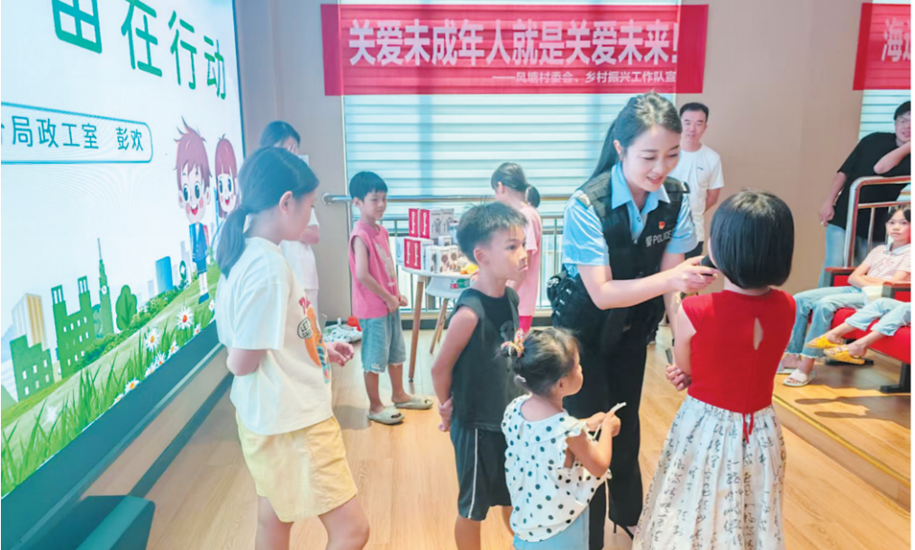
三亚市公安局海棠分局面向未成年人开展形式多样的普法宣传活动。

种党建引领、多方协同的模式，实现了资源共享、优势互补，为未成年人保护注入新动力。 3年耕耘，硕果累累。如今的海棠区，未成年人违法犯罪率持续下降，校园环境更加安全有序，家庭监护能力显著提升，全社会关心关爱未成年人的氛围日益浓厚，无数孩子在护苗行动中收获了温暖与力量。 未成年人保护工作永远在路上。“下一步，海棠区将继续深化护苗专项行动成果，完善家校社协同育人机制，持续优化‘四防’体系，不断创新工作方法，用爱心、耐心和责任心，为未成年人打造更安全、更健康、更温馨的成长环境，让每一棵‘幼苗’都能在阳光下茁壮成长，为海南自贸港建设培育更多栋梁之材。”三亚市海棠区委政法委有关负责人表示。（世鑫）