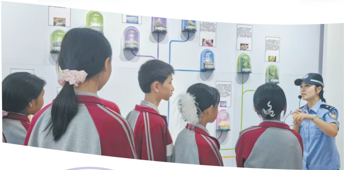
三亚市海棠区组织中小学生在禁毒教育基地接受再教育。