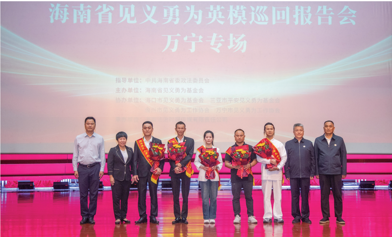
与会领导和报告团成员合影。