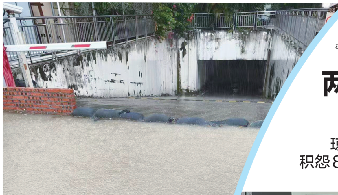
白沙坊社区豪城公寓门口整改前积水严重。

这是白沙街道党建引领基层治理推行“未诉先办”机制的一个缩影。自今年5月份以来,白沙街道通过“未诉先办”机制,已处理基层治理问题105个。每一个案例的背后,都是党员干部解决纠纷的“小妙招”。8月21日上午,记者跟随白沙街道党员干部走进白沙街道,探寻“妙招”背后的故事。