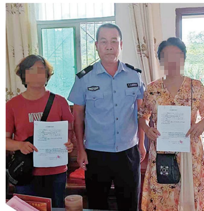
双方当事人代表达成调解协议后 在司法调解书上签名按手印。

8月19日,在民警和司法所工作人员的见证下,双方当事人代表握手言和,正式签订了调解协议,同时在司法调解书上按下了各自的手印。至此,延续多年的矛盾纠纷终于画上了圆满的句号。