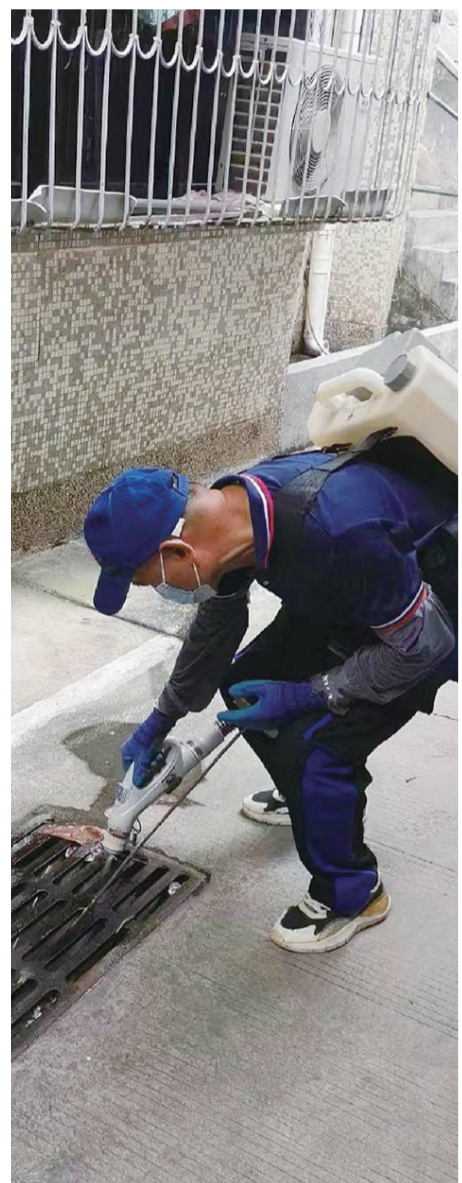
白沙街道岭下社区海轮宿舍北区灭蟑行动。