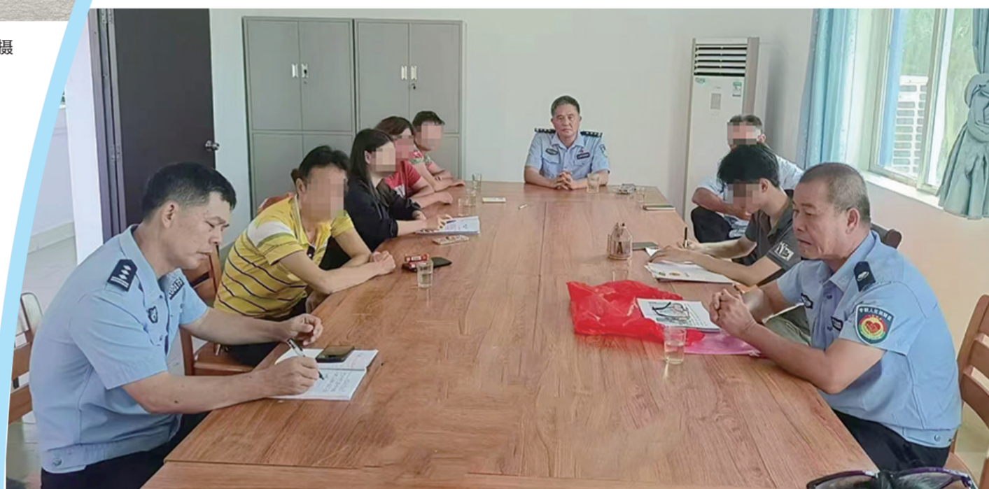
琼中警方组织双方当事人代表进行调解。