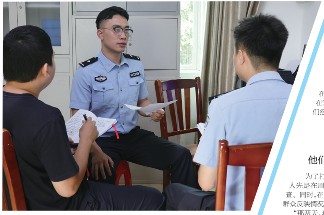
打击队员们加紧研判案情,找出蛛丝马迹。

为了打消群众疑虑,符警官、王警官等人先是在周边对4人的身份开展摸排和调查。同时,在他们居住地附近蹲点守候,查实群众反映情况是否属实。 “那两天,我们从白天蹲守到晚上,发现他们竟然一次门都没有出,太不符合常理了。”办案民警王警官说,经过研判,民警决定敲门对4人进行排查。 敲门后,一名男子打开了门。民警表明身份后,屋内的4人竟突然将手上、桌上的手机和电脑往楼下扔。 “开门后,我们看到1名男子躺在沙发上,2个房间内各有1名男子,客厅摆放着一张上下床,桌子上也是摆放了不少手机。”符警官介绍说,当时躺在沙发上的那名男子突然就蹦起来将手机扔下楼,民警们马上就想到了这是一个电信网络诈骗团伙的窝点。 见此情况,民警迅速反应,及时将4人控制住,当场扣押笔记本电脑2部、手机40余台。 “我们现场查看他们的手机时,发现他们在社交网络平台和多人同时聊天,聊天的内容都是叫网友做法事,付结缘费。”符警官介绍,警方经突审,了解到这是一个冒充大师祈福诈骗的犯罪团伙。