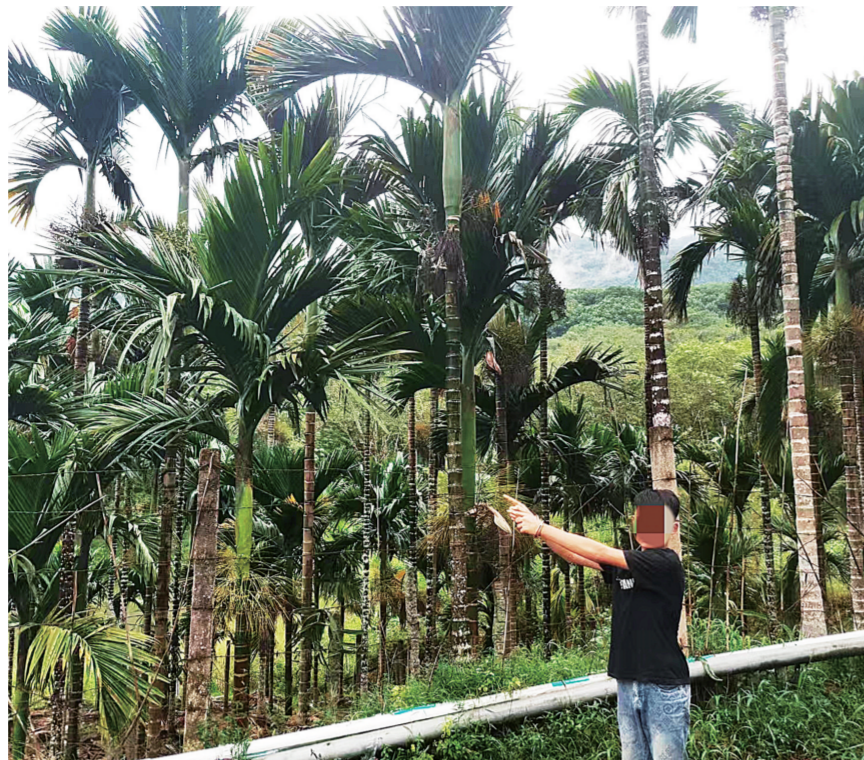
嫌疑人指认偷盗槟榔现场。