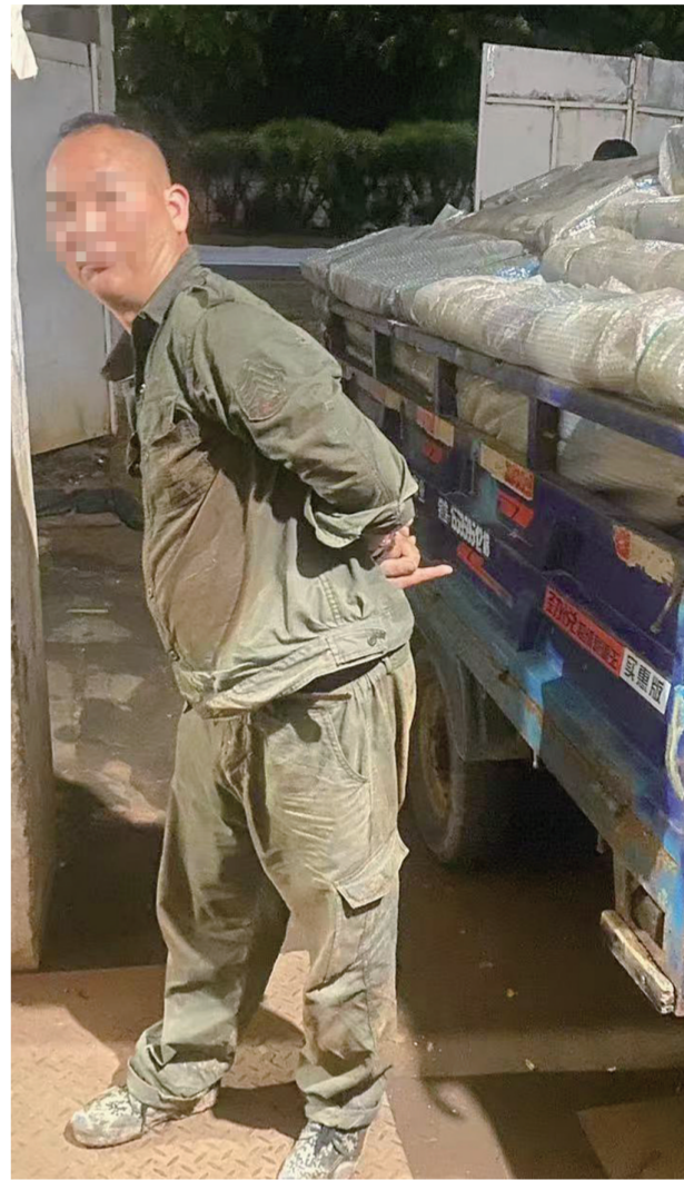
一名嫌疑人指认作案现场