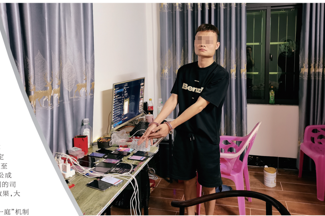
嫌疑人指认现场。