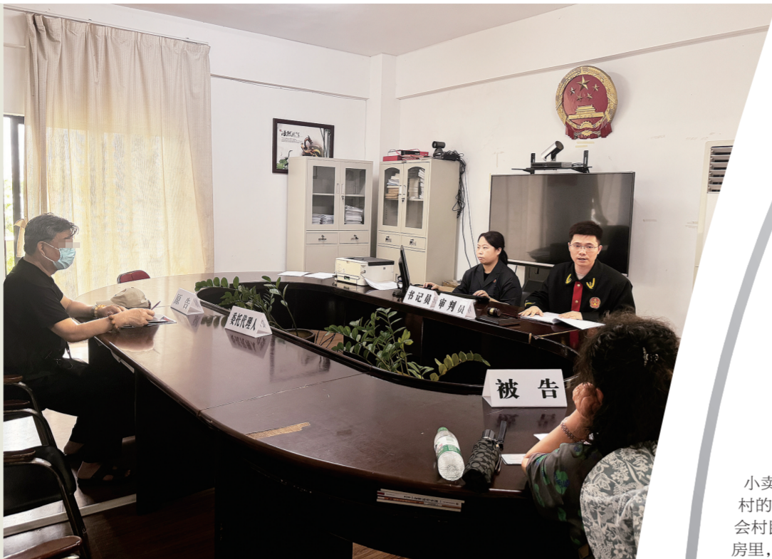
海口美兰灵山法庭法官在审理一起民事纠纷案。