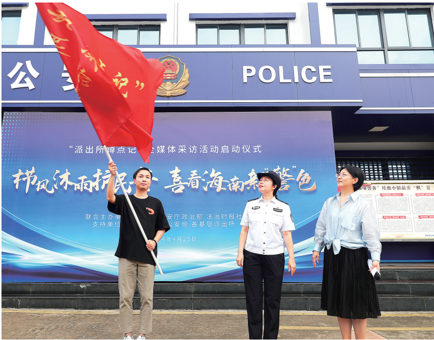
在启动仪式上,采访团记者代表接过授旗。

此外,法治时报记者将在蹲点派出所的过程中,同步深入调查研究基层警务工作的实际情况,并经过总结归纳,邀请海南法治传媒智库专家进行深入分析,结合海南自贸港建设形成专业的智库调查报告,为我省各级公安机关进一步改进和提升基层警务工作提供决策参考。