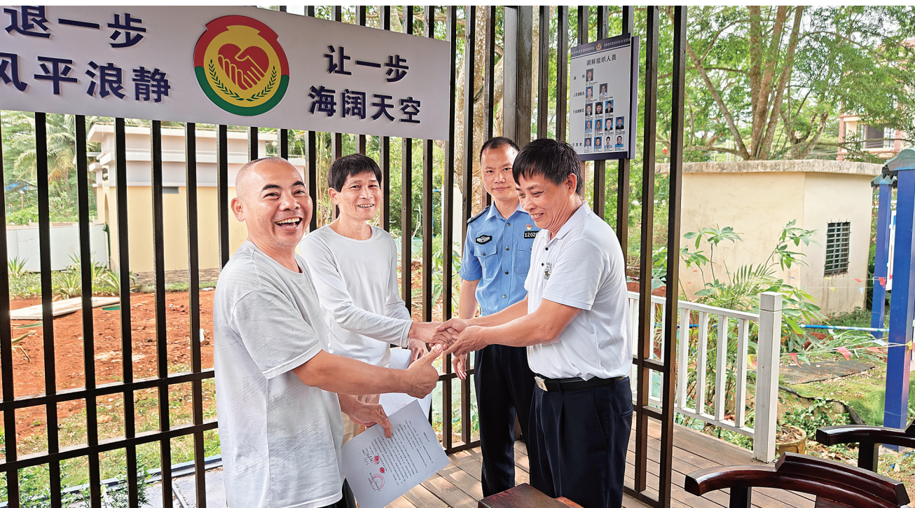
矛盾成功化解,当事人向民警和社区干部竖起大拇指。