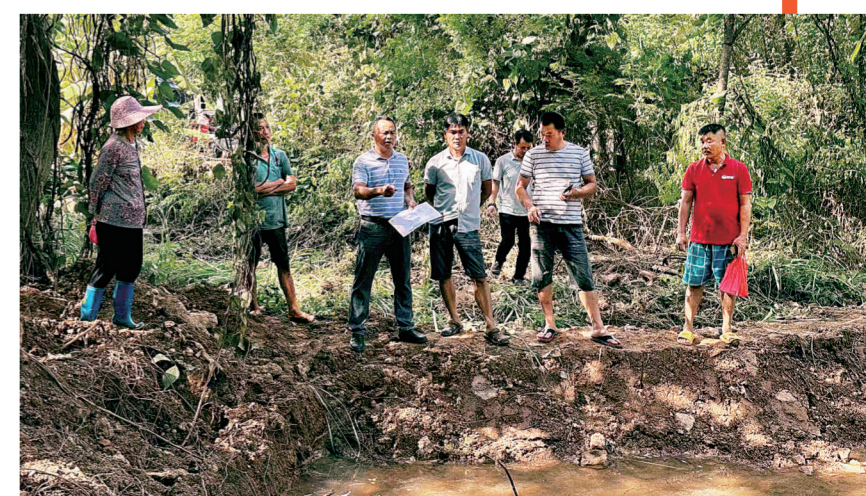
人民调解员到纠纷现场了解情况

同相关部门启动“紧急会诊”，快速到达现场为群众释法明理，平息涉事人员情绪，化解矛盾纠纷。今年以来，特色调解室调解员累计调解矛盾纠纷122件，调解成功率98%，获得基层群众的一致好评。下一步，昌江司法行政机关相关部门将继续做好各司法所指导人民调解和安置帮教工作，及时报送人民调解案件补助、各类报表和信息的报送等相关工作，努力完成省司法厅和县委、县政府、县委政法委交办的各项工作任务，把能动司法理念贯穿工作始终，补短板、强弱项、固根基，推进人民参与和促进法治工作机制创新，为推进平安昌江、法治昌江作出新贡献。（林晓清）