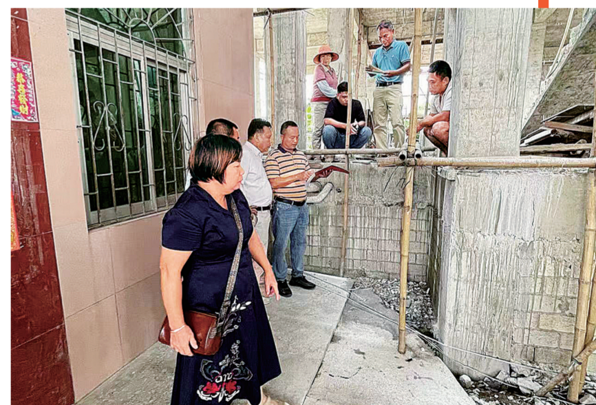
人民调解员到群众家中开展调解工作

今年1-10月，全县共排查各类矛盾纠纷521宗，调处521宗，调解率100%，调解成功511宗，调解成功率98.08%。多措并举创新打造“三型”调解工作室。为完善人民调解组织网络，创新人民调解组织形式，及时就地化解矛盾纠纷，昌江司法局积极探索人民调解组织新模式，打造红棉调解工作室、和好调解工作室、稻香调解工作室、哥隆调解工作室、奥亚调解工作室等5个亲民型、规范型、实用型人民调解工作室，充分发挥品牌调解室扎根基层、亲近群众的优势，以点带面，全面提高人民调解工作水平。