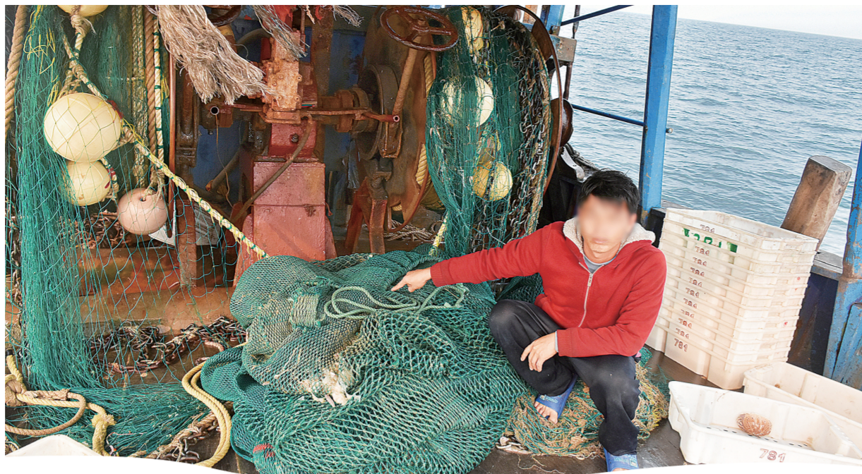
海南海警局查获一非法捕捞水产品案涉案人员指认作案工具