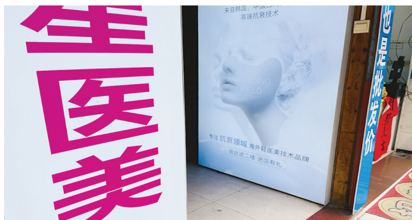
海口某医疗美容机构楼下悬挂的广告牌

何明雄解答：民法典第一千零五十三条规定：“一方患有重大疾病的，应当在结婚登记前如实告知另一方；不如实告知的，另一方可以向人民法院请求撤销婚姻。请求撤销婚姻的，应当自知道或者应当知道撤销事由之日起一年内提出。”据你所述，鲁某所患淋病，具有较强的传染性且难以治愈，应当属于重大疾病，且鲁某在登记结婚前对你未如实告知。因此，你诉请撤销该婚姻，法院会依法支持的。民法典第一千零五十四条第二款规定：“婚姻无效或者被撤销的，无过错方有权请求损害赔偿。”据此，你可以要求鲁某承担损害赔偿，但必须在法律规定的时间内。