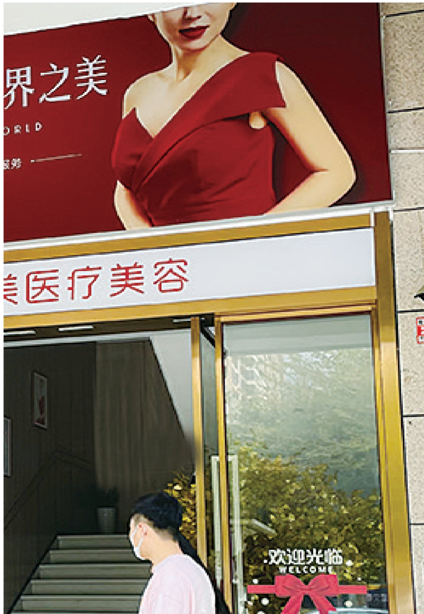
海口某医疗美容机构

法院经审理认为，公民的生命健康权受法律保护，纹绣店的工作人员在为小花进行纹眉的过程中，因操作不规范，将手按压在小花左眼处，导致小花左眼黄斑区出血，经鉴定机构鉴定，确认小花因手按压左眼与左眼黄斑区出血存在因果关系，工作人员的行为已构成侵权，吴某作为该店的经营者，应当为该店工作人员的侵权行为承担责任。据此，法院依法判决吴某限期内向小花支付医疗费19634.51元、交通费200元、后续治疗费8000元（以一年计算）、精神抚慰金3000元。