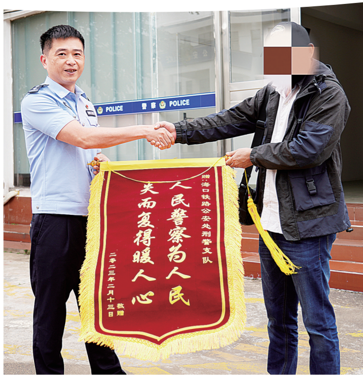
受害人将锦旗送给海口铁路公安处刑警支队民警