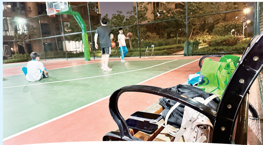
海口市龙华区碧桂园某小区篮球场，手机、背包等物品被放置在一旁

民警提醒：到球场等运动场馆运动时，一定要提高警惕，注意观察周围形迹可疑人员。不要将手机、钱包等贵重物品随意放在边上。如果条件允许，应存放在有人看管的地方，以免被不法分子钻空子。如发现物品丢失，要及时报警。